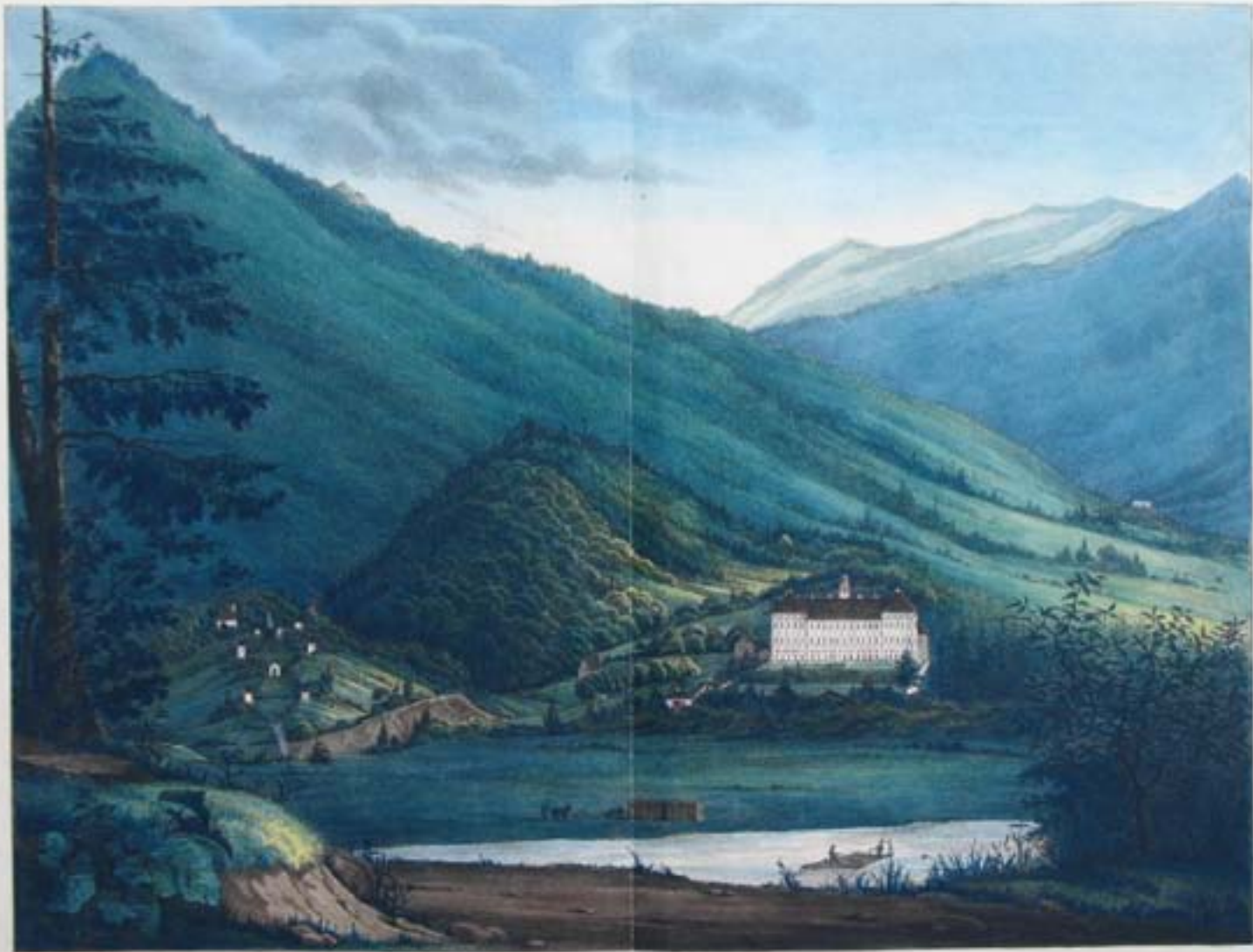
HOHENBURG an der Saar