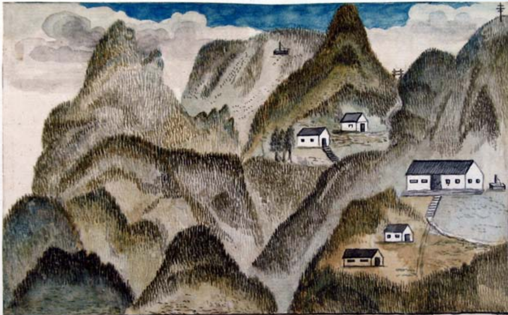
Die Hochgräf. Hör Warthische Alm oder Dichtwaide