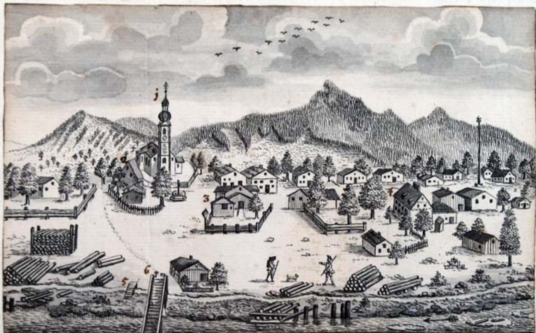
Prospect der Hofmark Lengries, wie es gegen Aufgang zu sehen. 1. Pfar. 2. Pfar- hof. 3. das Wirthshaus. 4. das Waiselhaus. 5. Mühlbach. 6. die Iserbruck.